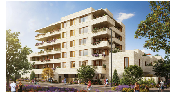
Appartement A51 - 2 pièce(s) Hall : A - Etage : R+5