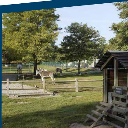
Ferme des Gondoles