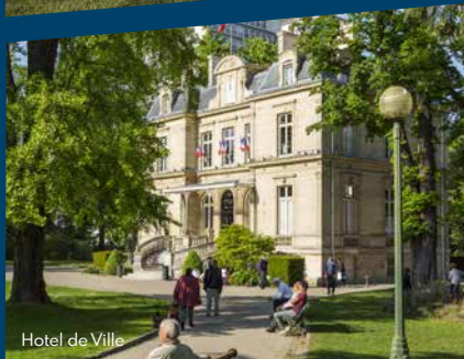
Hotel de Ville