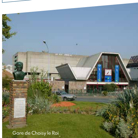
Gare de Choisy le Roi