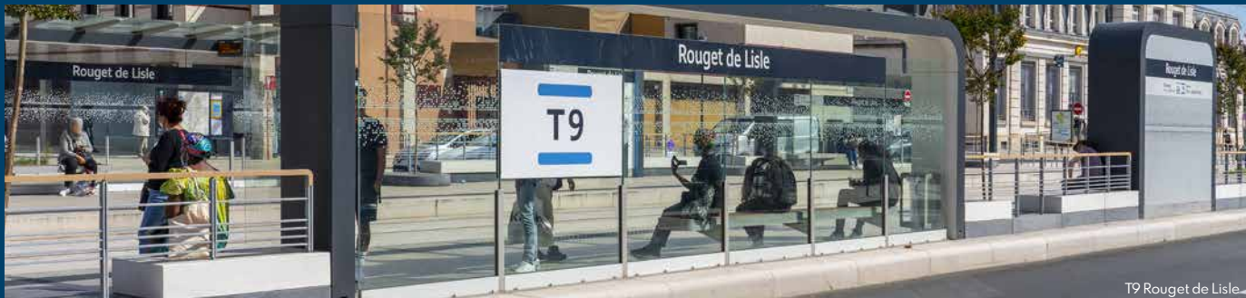
T9 Rouget de Lisle

*Estimation du temps à pied. Source Google Maps.