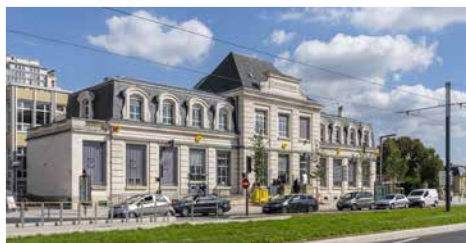
Avenue Léon Gourdault