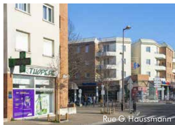
Rue G. Haussmann