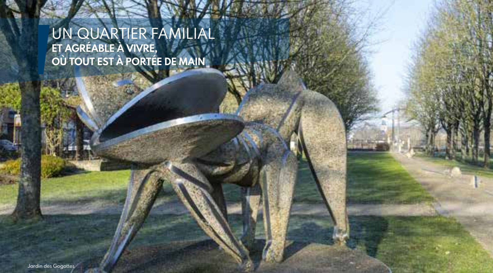
Jardin des Gogottes