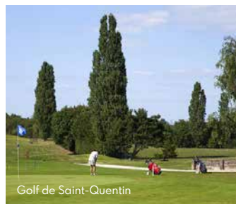
Golf de Saint-Quentin