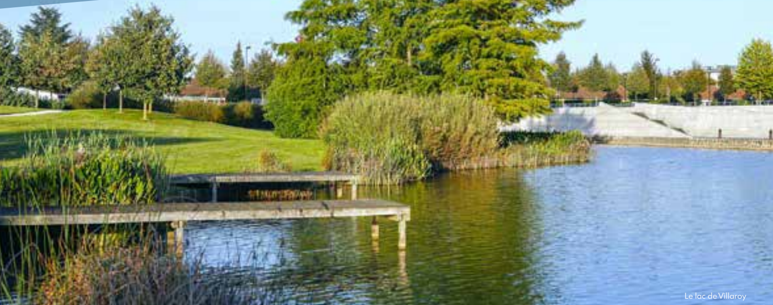
Le lac de Villaroy