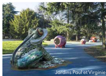
Jardins Paul et Virginie