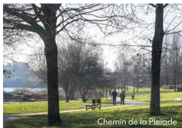
Chemin de la Pleiade