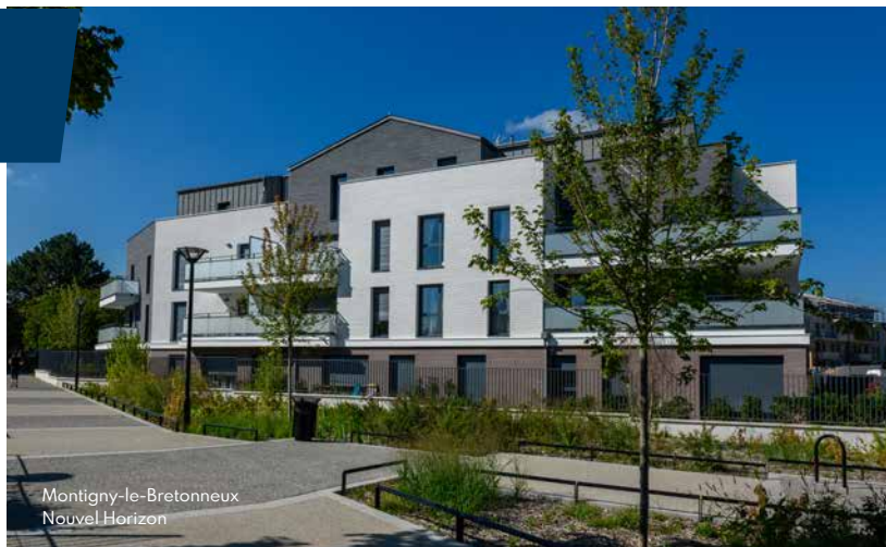
Montigny-le-Bretonneux Nouvel Horizon