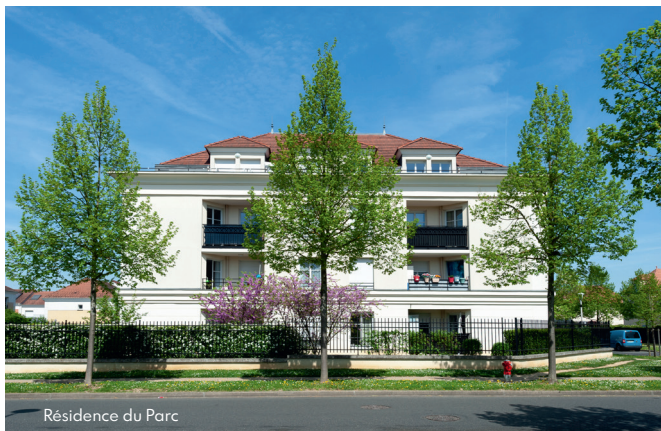
Résidence du Parc