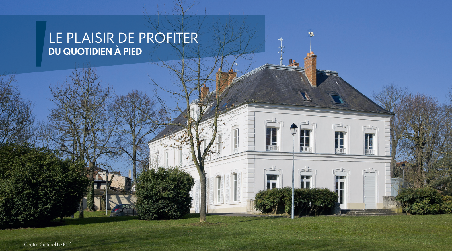
Centre Culturel Le Fief