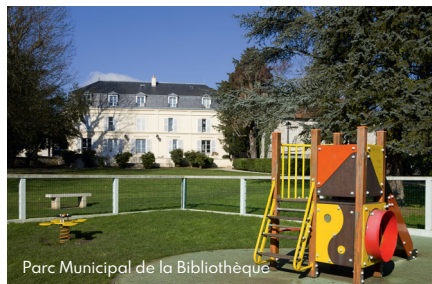
Parc Municipal de la Bibliothèque