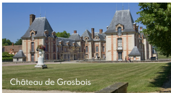
Château de Grosbois