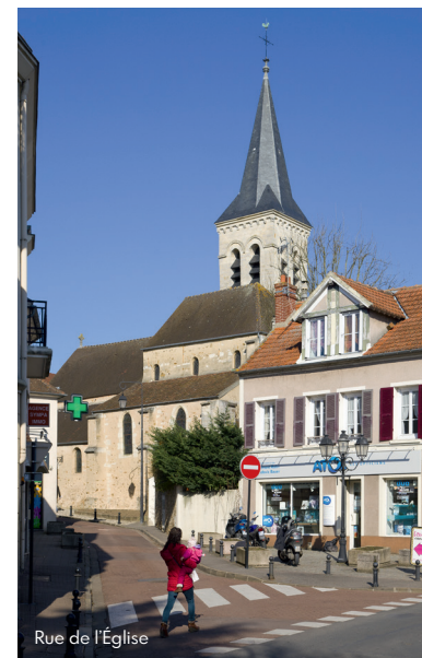
Rue de l'Église