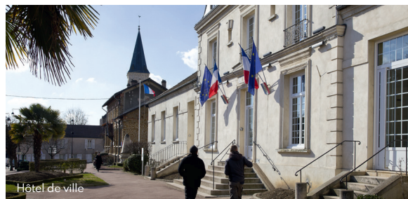
Hôtel de ville