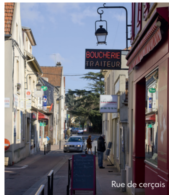
Rue de cerçais