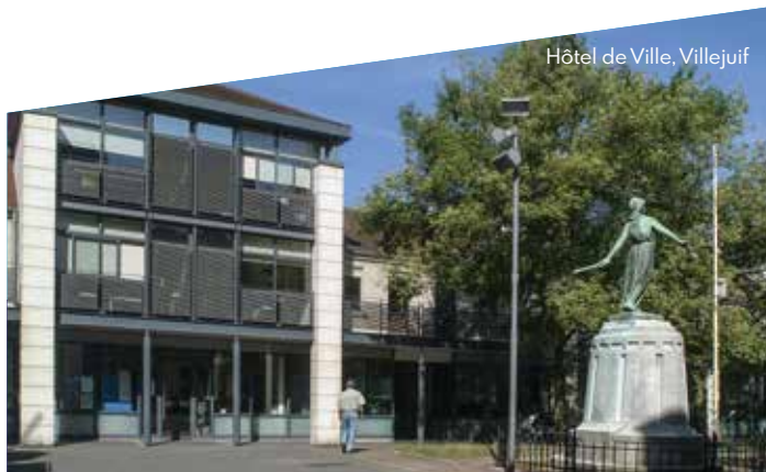
Hôtel de Ville, Villejuif