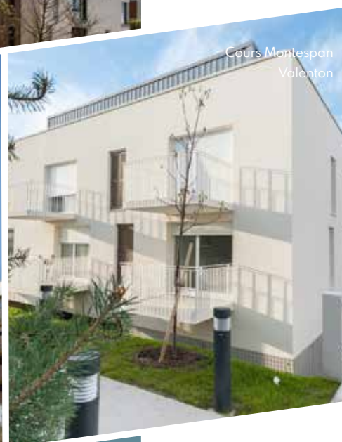
Cours Montespan Valenton