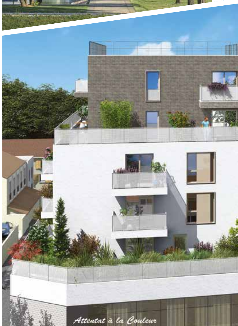
Attentat à la Couleur