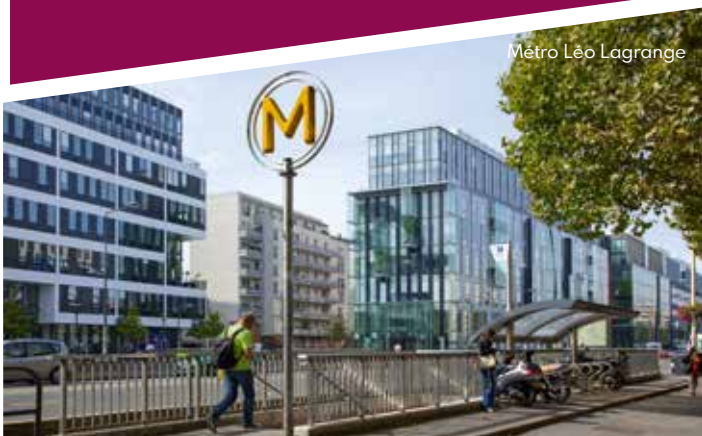
Métro Léo Lagrange

À 5 minutes à pied de la station de métro « Villejuif-Léo Lagrange » et à 200 mètres de l'avenue de Paris ainsi que de tous ses commerces, la résidence s'insère au cœur d'un environnement résidentiel agréable. À quelques enjambées, le collège Louis Pasteur, l'école maternelle Henri Wallon ou encore le stade Gabriel-Thibault viennent parfaire tous les atouts proposés par cette adresse de qualité.