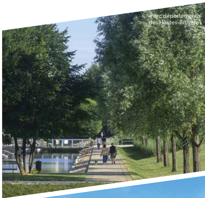
Parc départemental des Hautes-Bruyères

À 1,5 kilomètre de la Porte d'Italie, entre les vallées de la Seine et de la Bièvre, Villejuif séduit par son cadre agréable et pratique. En plein essor économique, elle dispose d'une desserte en transports en commun particulièrement efficace : ligne 7 du métro, future gare du Grand Paris Express, tramway T7 ou encore nombreuses lignes de bus reliant les communes voisines. Elle offre également un accès direct au boulevard périphérique et aux autoroutes A6B et A86. Dotée de tous les commerces et services nécessaires au quotidien et de nombreux espaces verts, elle conjugue tous les atouts d'une ville où il fait bon vivre.