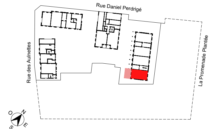
Plan de localisation